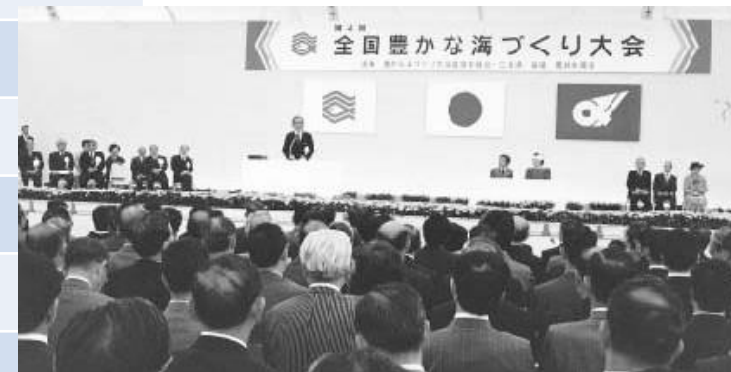
1984年(昭和59年)第4回三重県大会