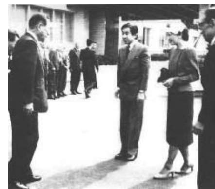
三重県大会(水産技術センターご視察)

未開催の都府県は、栃木県、群馬県、埼玉県、東京都、山梨県、大阪府、長野県、岡山県